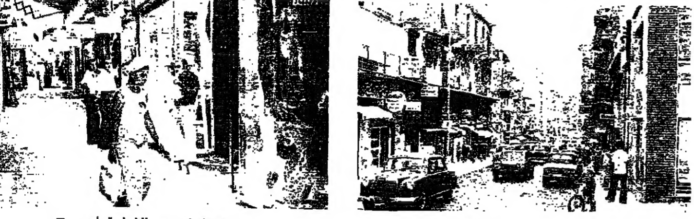
الحركة في سوق الطويلة امس

شهدت شوارع العاصمة والحركة التجارية حالة من الشلل والجمود، رغم استمرار الماء الكهربائي، وشلل الشغل معظم المرافق الاقتصادية والإسكان العامة. وكانت معظم المحلات التجارية، والصناعية، والمصارف، والشركات، قد غلقت أبوابها كالمعتاد صباح أمس، إلا أن تسببها عاد إلى الاتصال في شجرة الظهر، بسبب انقطاع الماء، وغيب بعض المستهلكين، ووجدت الاشتباكات في بعض المناطق، وكانت حركة السير بطيئة، في منتصف نهار أمس، ثم خفت تدريجياً، في شجرة الظهر، فدرجة ان الزحام اقتصر على محطات بيع البنزين.